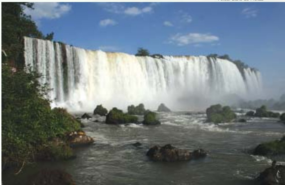
Visita às Cataratas do Iguaçu: cenário era de tirar o fôlego

Para encontrar diversão, não foi preciso ir além das instalações do Hotel Bourbon Cataratas. Ali mesmo os representantes do setor e suas famílias contaram com ampla