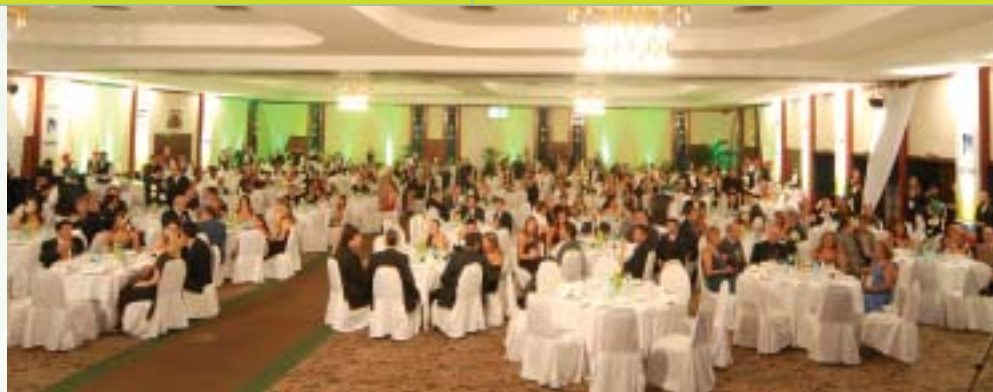
Encerramento: todos aproveitam cada momento do jantar dançante

apoio de dezoito empresas identificadas como apoiadoras – Alpex, Arbax, Belga Metal, Dorma, Instituto Falcão Bauer da Qualidade (IFBQ), Glass South America (Nielsen Business Media Brasil), Glass Vetro, Gusmão Representações, Glaston, Glasspeças, Saflex (Solutia), SAP Channel Partner (Exapp), ScreenLine (Eurocentro), Tec-Vidro, Terra de Santa Cruz, Use Mak e Vip Door. Utilizando totens, as companhias lançaram produtos, conheceram o mercado e fortaleceram a marca ( veja matéria completa na página 42 ). Quatro delas (Dorma, Eurocentro, SF Informática e Exapp – SAP Channel Partner) divulgaram seus lançamentos através de