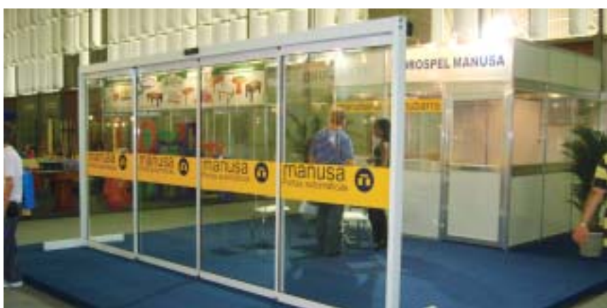
Manusa: portas automáticas