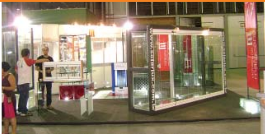
Vidraçaria Maracanã: sistema de fechamento de vãos da Solarlux