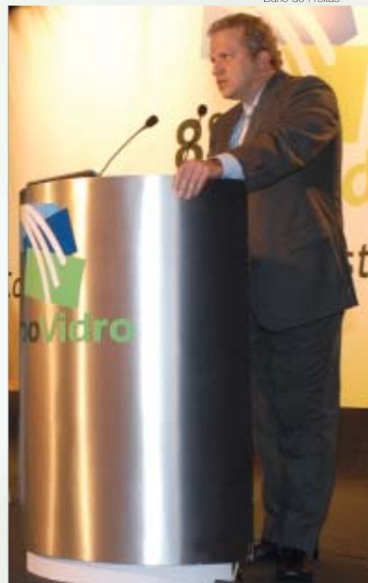
Tirone: tendências para o mercado de vidro impresso

Atualmente, a fábrica de vidro impresso do Grupo Saint-Gobain no Brasil possui capacidade instalada para produzir 165 toneladas diárias. De acordo com Tirone, para aproveitar toda a potencia-