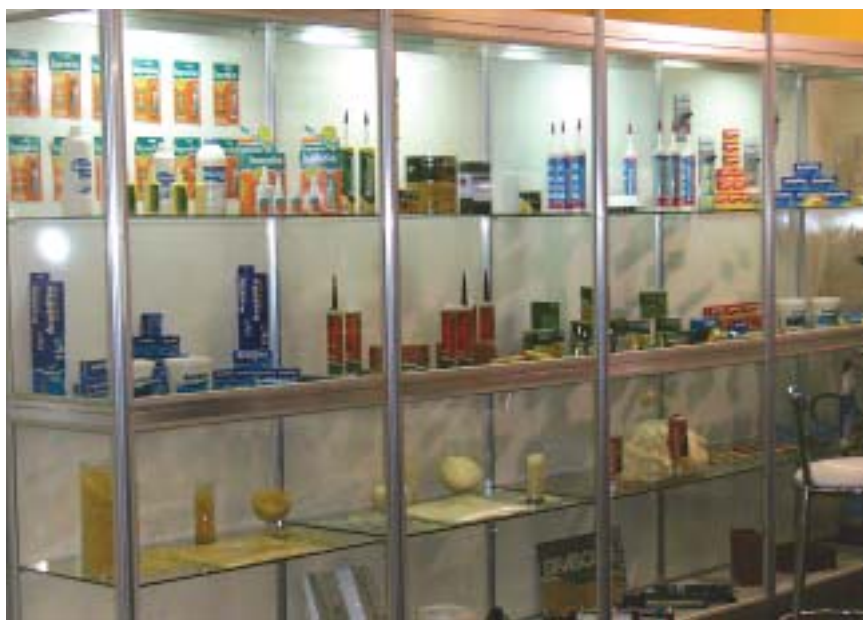
Brascola: adesivos e silicones próprios para superfícies de vidro