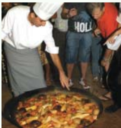
Carneiro no buraco: prato típico do Paraná