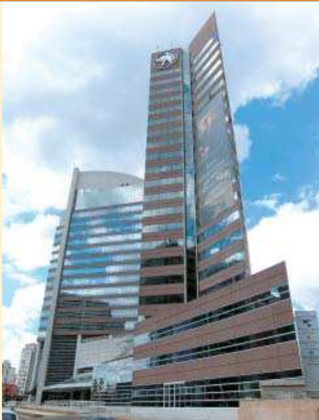
Linha de refletivo da Cebrace reveste fachada do Ceasar Park em Guarulhos, São Paulo