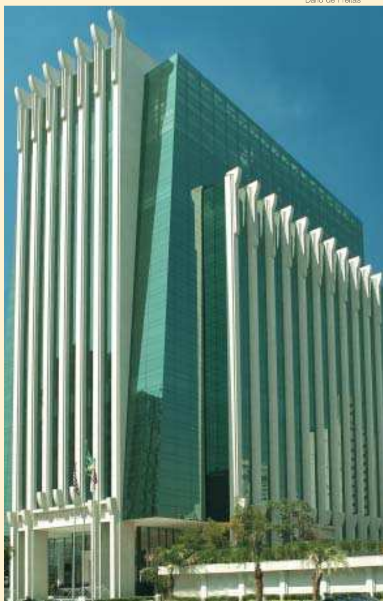
Faria Lima Square: edifício de São Paulo recebe vidros com controle térmico da Guardian