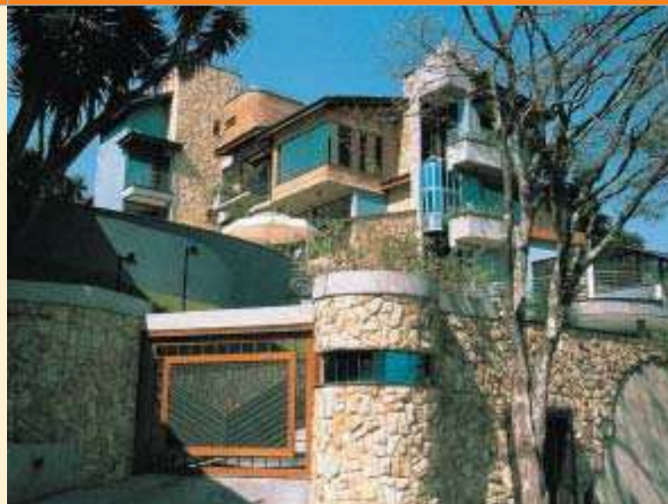
Da Insulfilm: película recebe camada de metal para proporcionar desempenho térmico