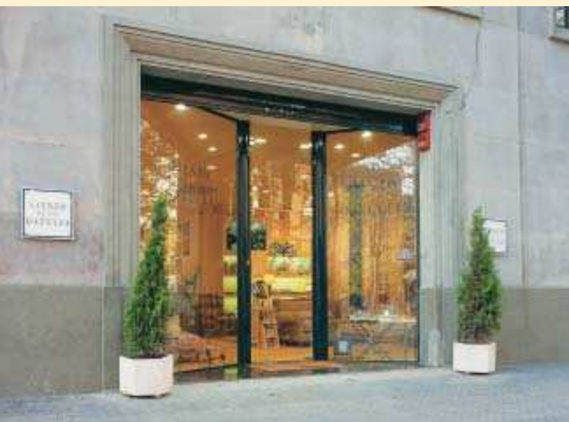
Filmes claros, como esse da Bekaert, são capazes de permitir a entrada de 70% da luz