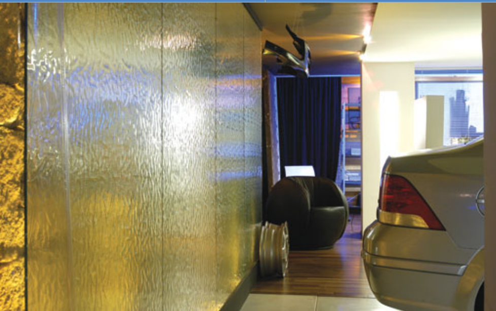
Ambiente da Casa Cor PR: vidro laminado impresso