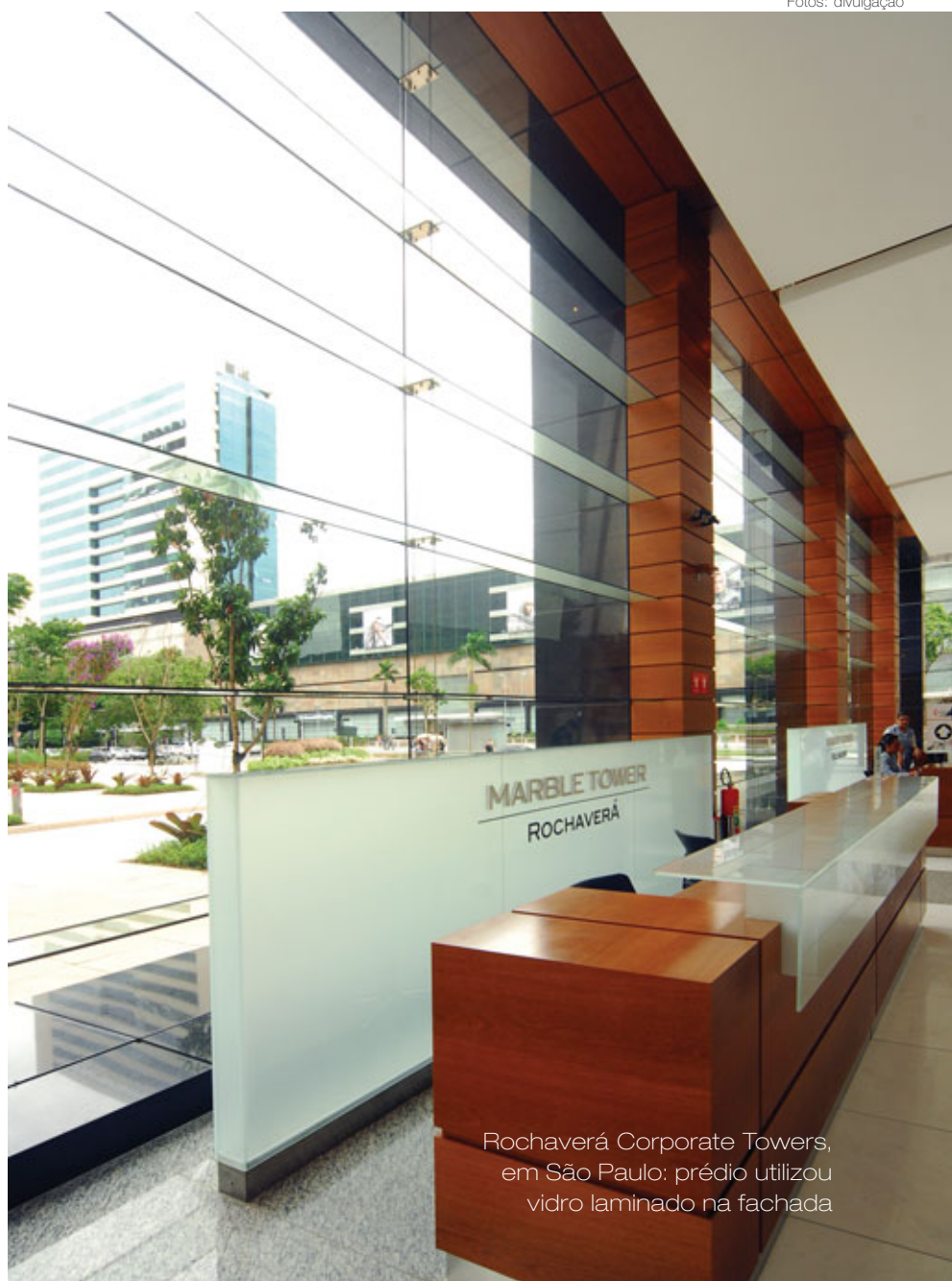
Rochaverá Corporate Towers, em São Paulo: prédio utilizou vidro laminado na fachada